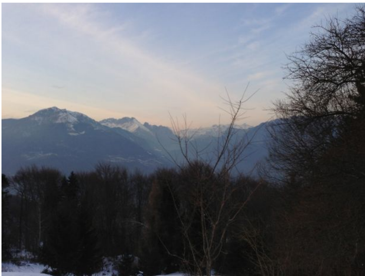
La vista sulla vallata, da Monte Campione, verso Artogne

Ma tutto comincia prima, «con il caso dei profughi dalla Tunisia» Arrivati in Italia, ricevono un permesso di protezione umanitaria: temporaneo, e che permette di vivere e di lavorare in Europa. «Una volta ottenuto, lasciano l'Italia e vanno in Francia». Parigi, di fronte al flusso, blocca la frontiera: nasce un caso internazionale delicatissimo, da evitare di ripetere. E allora «nella seconda ondata, di profughi provenienti dalla Libia, che sono quelli che poi sono finiti in Val Camonica, si è preferito agire in modo diverso». Niente protezione umanitaria, e distribuzione – provvisoria – nel territorio nazionale. In attesa di ratificare la posizione giuridica dei profughi, attivando la procedura dell'asilo politico. «Per la gestione, se ne occupa la Protezione Civile, che in questo caso applica una logica da emergenza». I rifugiati, arrivati a Lampedusa, vengono suddivisi per ogni regione e provincia d'Italia, seguendo il criterio della popolosità. «In Lombardia, però, si verificano proteste da parte della Lega, che chiede di modificare questo criterio, e di guardare alla popolazione di stranieri già presenti in ogni regione». Proteste che cadono nel nulla. Tutto prosegue.