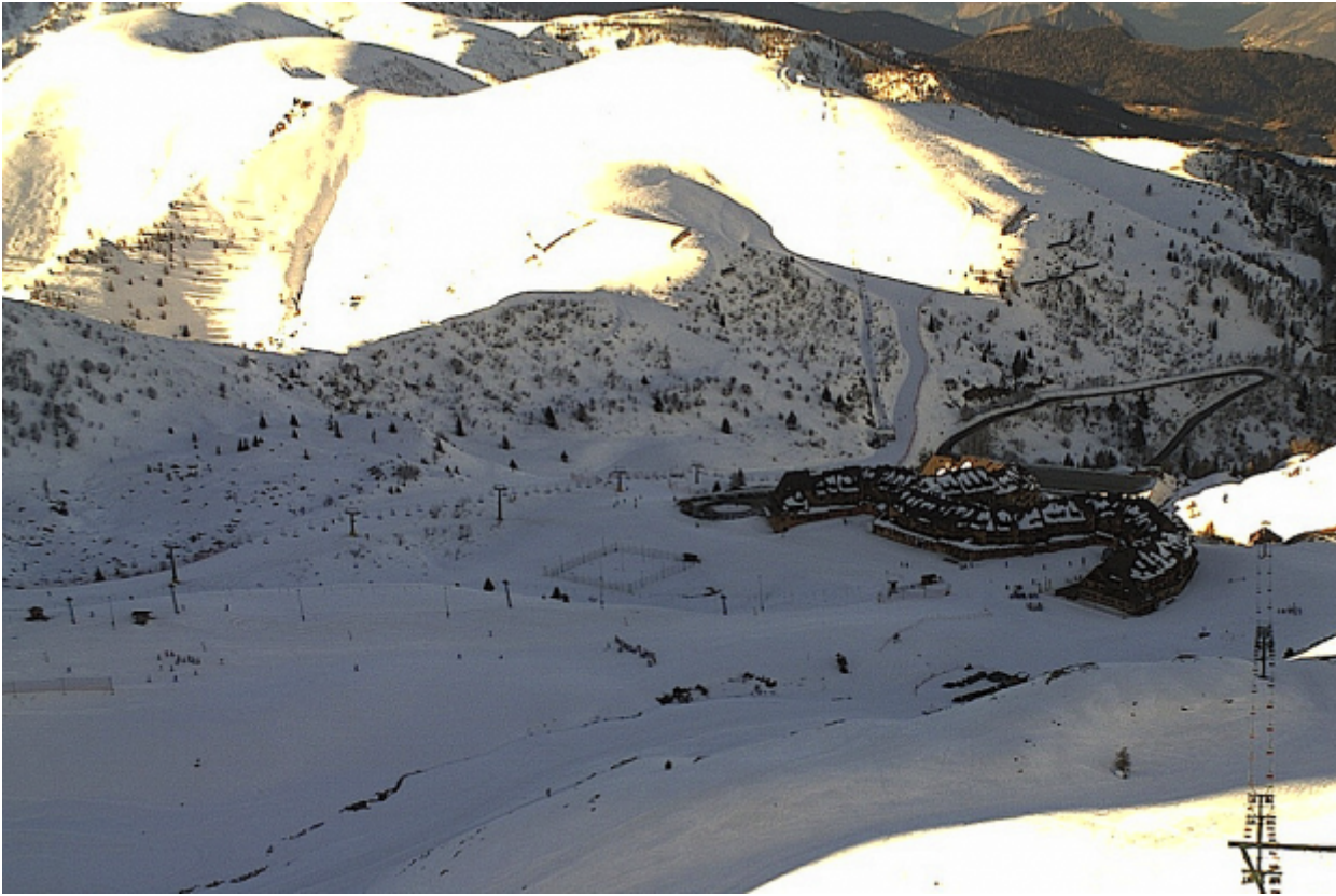
Il "serpentone", Residence Le baite, che ospitava i rifugiati

Qualche giorno dopo, «sono andato ad accogliere il convoglio Eravamo io e due rappresentanti delle forze dell'ordine, a 1800 e guardavamo in vallata». E sotto, un pullman seguito da un'auto dei carabinieri che si inerpicava con difficoltà sulla strada tortuosa.